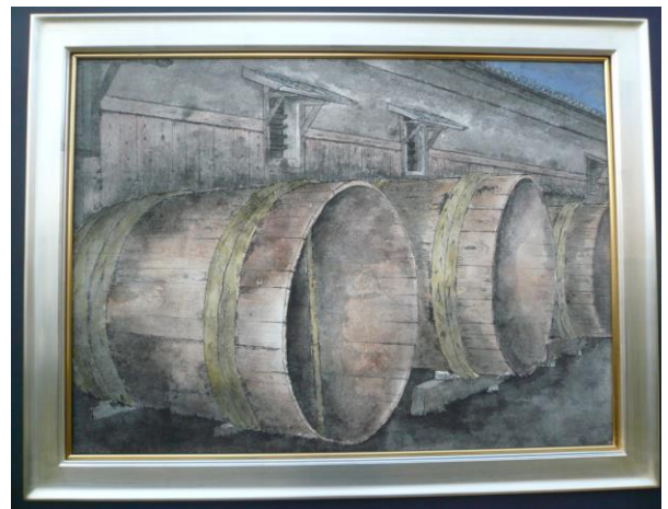
「仕込みを待つ」 （「全国水墨画公募展 2013」入賞）